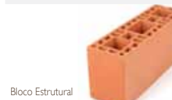
Bloco Estrutural de 44cm - código 35