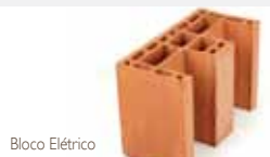
Bloco Elétrico código 44