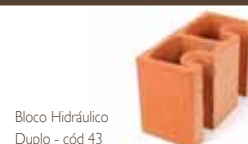
Bloco Hidráulico Duplo - código 43