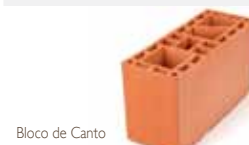
Bloco de Canto código 54