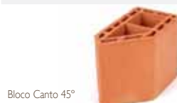
Bloco Canto 45° código 49