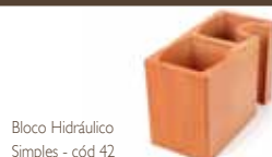
Bloco Hidráulico Simples - código 42