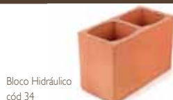
Bloco Hidráulico código 34